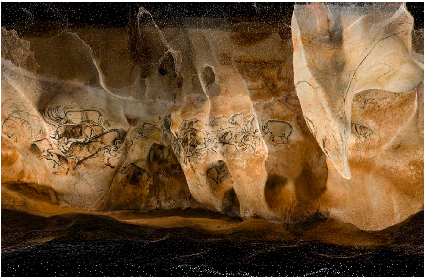
La salle du fond de la grotte Chauvet abrite des dizaines de figures noires tracées au fusain de charbon de bois. Image issue du modèle 3D

La grotte est parfaitement conservée , essentiellement grâce à la fermeture brutale de son porche d'entrée il y a 21 000 ans . Ainsi, les figures sont exceptionnellement bien conservées et les sols comprennent des empreintes de pas humains et des milliers d'ossements d'animaux , en particulier des ours. La caverne est également d'une grande richesse minéralogique.