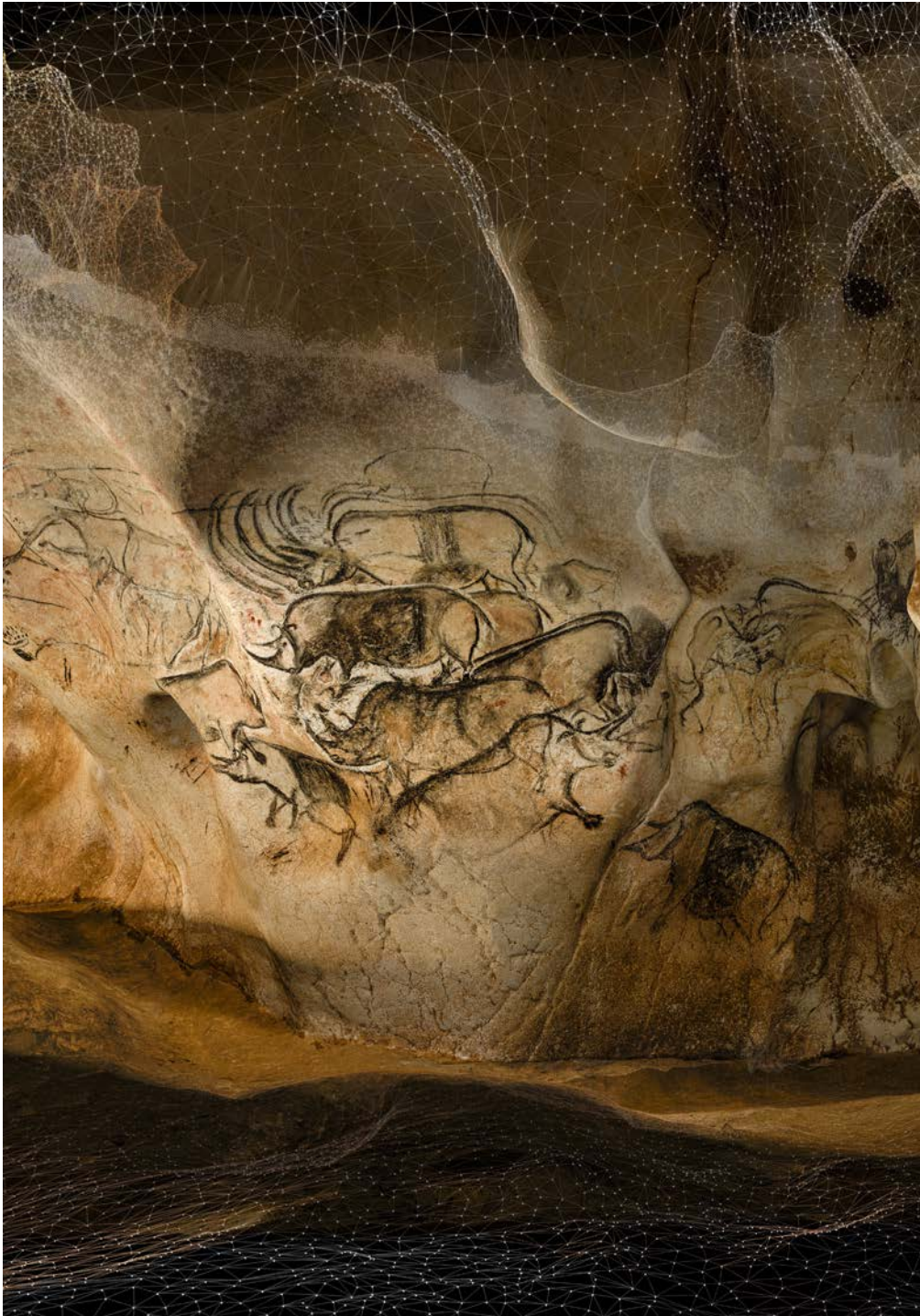
La charge des rhinocéros très réalistes, au préalable observée dans la nature par nos ancêtres

La grotte Chauvet-Pont d'Arc a été entièrement numérisée en 3D au moyen de scanner capable d'enregistrer la position dans l'espace de points situés sur les parois, au dixième de millimètre près. Au total, les coordonnées spatiales de seize milliards de points ont été enregistrées , pour obtenir un « nuage » d'une très haute précision. Puis, ces points ont été reliés entre eux et des photographies en haute définition ont été superposées à cette surface informatique. Le clone 3D ainsi obtenu permet d'étudier, conserver et révéler l'art des origines.