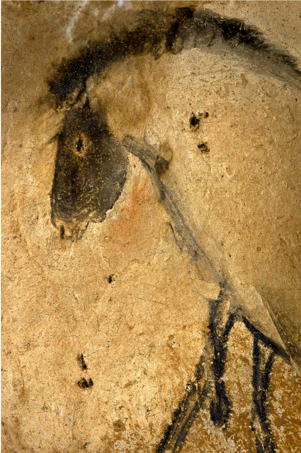
Le cheval de l'alcôve centrale du panneau de la salle du fond

Contrairement à des grottes ornées plus tardives, les artistes de Chauvet-Pont d'Arc ont surtout représenté des animaux dangereux, craints et respectés pour exprimer les mythes fondateurs : la charge du rhinocéros, l'alcôve du petit cheval, la harde de félins en chasse, l'ours des cavernes ! 15 espèces animales sont représentées selon 9 techniques : dessin, peinture, gravure, estompe, perspective, représentation du mouvement, exploitation du relief, tracé digital, représentation tridimensionnelle.