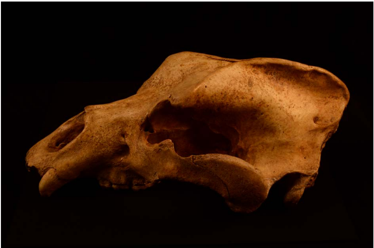
La grotte Chauvet a été occupée régulièrement par l'ours des cavernes